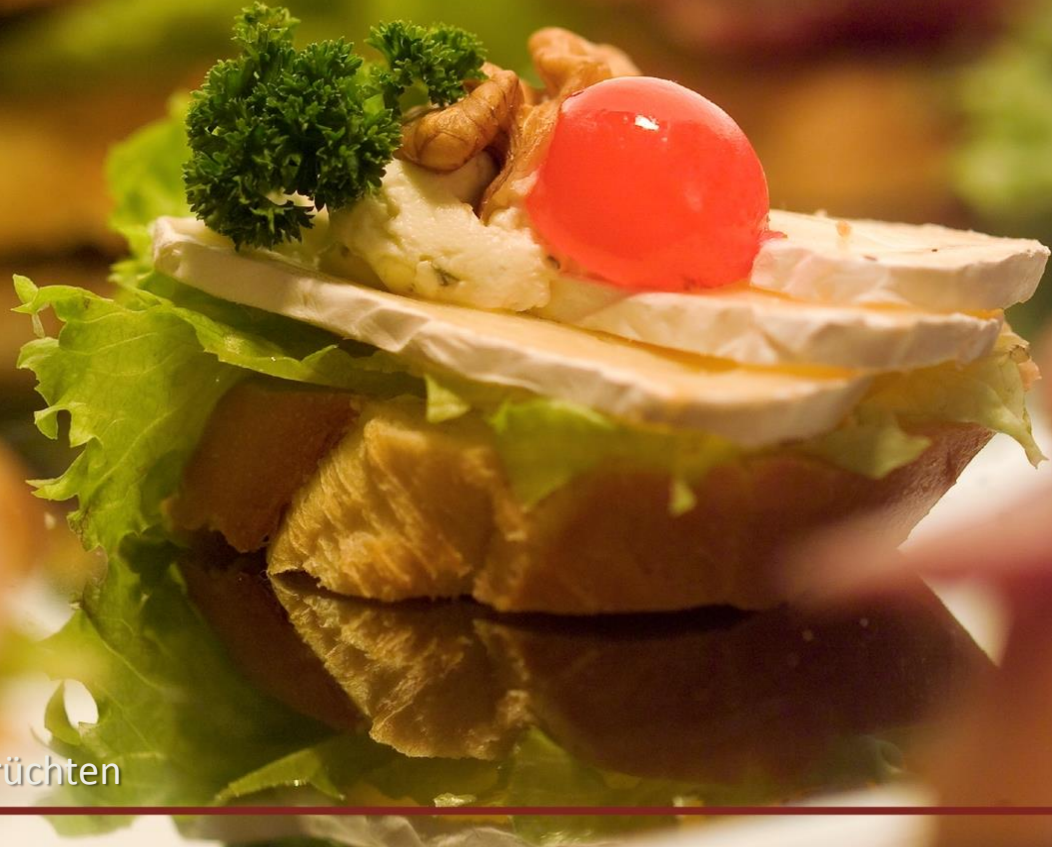
Feiner Weichkäse mit Früchten